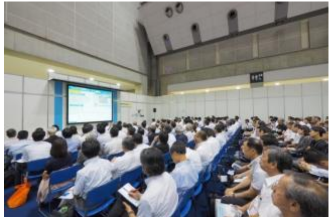
<写真は 2016 年の様子>

【本件に関する問い合わせ先】 一般社団法人日本能率協会 産業振興センター内 (担当: 倉品)