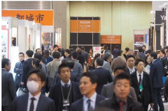
商品企画・開発担当者やバイヤーが多数来場

食品をはじめとする OEM・PB 受託企業やパッケージなどの開発支援企業が出展、大手小売や有名ブランドメーカーと OEM・PB 受託メーカーの商談がくり広げられる商談専門展示会です。ぜひご来場ください。ぜひご来場ください。