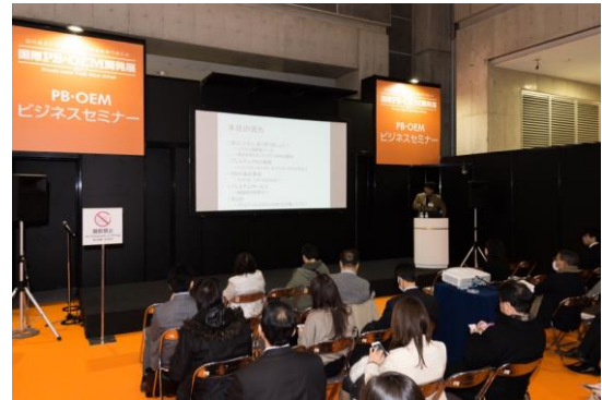
国内外で活躍する専門家が登壇するセミナーも人気