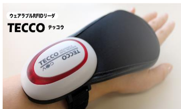
ウェアラブルRFIDリーダ TECCO テッコウ

カワダロボティクス（ブースNo.8-407）は、労働力の確保ができないという課題に対して、ビジョン認識機能を備えた双腕型ロボット「NEXTAGE」が人間のパートナーとして働くアプリケーションを提案