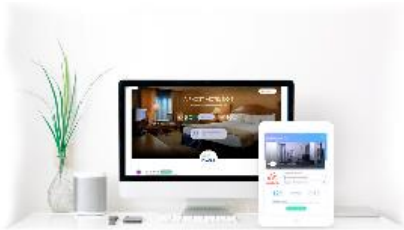
無人ホテル運営を可能にする『AirHost チェックイン』

2018年の訪日外国人旅行者は3,119万人（出典：2019年、日本政府観光局リリースより）と過去最高となり、アジア各国からの観光客訪問地として人気の九州でも、その受け入れ体制を整えておく必要に迫られています。