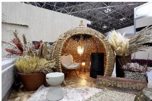
「ビッグドームハウス」

QRコードひとつで、各自、各国のSNS間での筆談及び口頭の会話が可能になります。Google翻訳などの機械翻訳システムを使い、100種類以上の言語に対応しています。