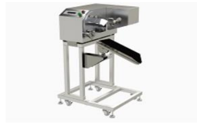
高速電動ピーラー「匠助」

りんご、梨、柿、キウイ、オレンジ、グレープフルーツ、レモン、柚子、桃、洋なし、トマト、カブ、タマネギなど、多種の皮剥きが可能！