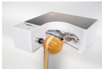
電動ピーラー「瞬助」