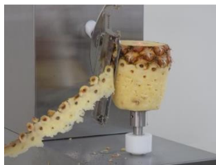
電動ピーラー「大助」