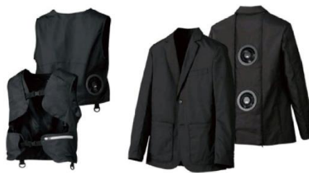
チクマノスマファ