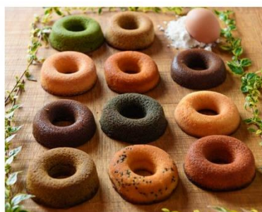
萬平ドーナツ (全11種)