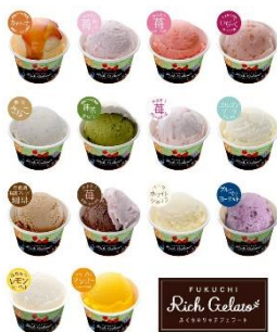
ふくち★リッチジェラート (小売用100mlカップ) 全14種

見どころ:かつて炭鉱業で栄えた福岡県筑豊地方の福智町。地元で毎年開催しているスイーツイベントでも大人気のご当地ジェラートや焼きドーナツをご紹介します。