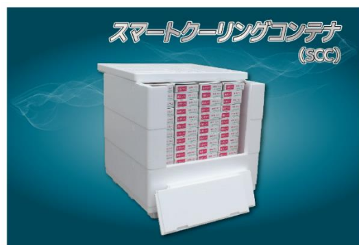
スマートクーリングコンテナ