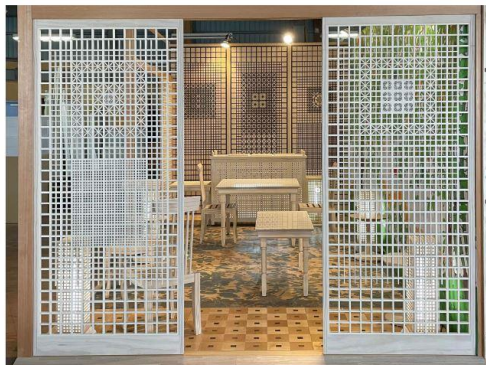
屋外用 Kumiko スライドドア

見どころ:「デザイナーと作り手が共に創る」新たなエクステリア空間づくりを提案していきます。 デザイナーは、「ななつ星in九州」などを手掛けられた水戸岡鋭治氏が担当し、家具産地大川のメンバー18社が集まった「大川社中」グループ企業で製作し今回出展しております。商品のエクステリア素材には、屋外で50年、地中および淡水中で25年間という耐腐朽菌耐用年数がメーカー保証されている木材を使用して、デザイナーと企画調整を重ねてエクステリア空間を演出し、体験が出来るブースとなっております。