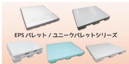
EPSパレット/EPSユニークパレットシリーズ

見どころ:農産物の輸送容器はもちろん、軽量で湿気に強い「EPS パレットシリーズ」や大型保冷コンテナ「スマートクーリングコンテナ」など、発泡スチロールの特性を活かした様々な商品を取り揃えております。また、お客様のご要望や用途に合わせ、カスタマイズ可能です。