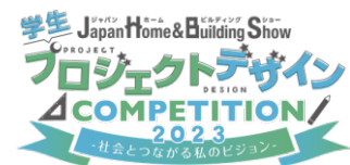
「学生プロジェクトデザインコンペティション」ロゴマーク

プロジェクトデザインは社会問題に対して、前提条件からデザインを行い問題解決を行うことです。どの地域でどのような人を巻き込んだら何が出来るようになるのかなど、問題提起から敷地、用途、運営主体まで自ら設定し、それらの条件をデザインで解決します。