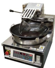
自動中華調理機 ロボシェフ

国内主要メーカーのエレベーターと連携し、自律的な上下移動を可能にしたロボットソリューションです。スタッフの手を介さずとも、ロボットが自らエレベーターに乗り込んで目的のフロアへ到達できるため、施設内の清掃や客室へのアメニティ運搬など、フロアをまたぐ業務の代行を実現します。