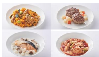
愛犬用レトルト惣菜「eugreen お惣菜シリーズ」

商品を画像で POS データ登録し、会計時にカメラを通して AI が自動で画像認識して、商品の詳細や費用を表示。会計システムに連動出来ます。