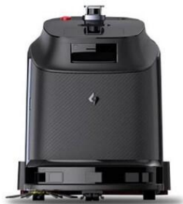
エレベーター連携可能な清掃ロボット