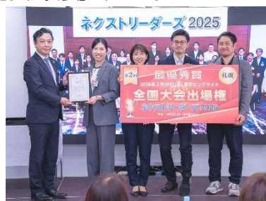
【札幌代表】けっぱれ！