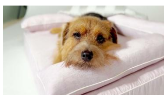
最高クラスの体圧分散で、愛犬に「究極の眠り」を「ロイヤルベッド」