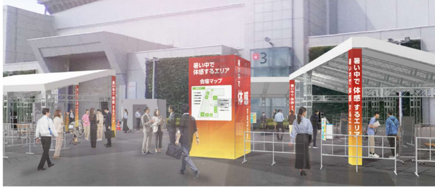
「暑い中で体感するエリア」(屋外エリア) イメージ図

今回初の試みとして、屋外、および屋内に暑熱環境エリアとして「暑い中で体感するエリア」を新設し、出展者 21 社の暑さ対策製品・サービスを実際に体験いただけます。実際の暑さの中だからこそ分かる製品性能や使い心地を、その場で比較検証できる注目企画です。