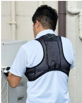
アイスタッチデバイスベスト